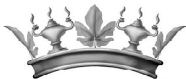
3 – Coronel do Politécnico de Lisboa

ção, existindo uma muito interessante criação de coronéis próprios para certas áreas, sendo disso bons exemplos os coronéis dos três ramos das forças armadas, foi decidido propor a criação de um coronel específico a um estabelecimento de ensino superior das ciências aplicadas e das artes, mas evitando o uso de um coronel de livros como o utilizado na Escola Superior de Enfermagem do Porto. Optou-se por uma composição com folhas de figueira, simbolizando a aplicação dos conhecimentos que deve caracterizar o ensino superior, representando as ciências e artes alicerçadas na pesquisa e execução, e com lanternas bilícnias, simbolizando a luz do espírito, a difusão do conhecimento e aludindo ainda ao estudo como atividade primordial do Instituto, sendo que o número de chamas corresponderia também às duas vertentes por este cultivadas: as ciências e as artes (fig. 3).