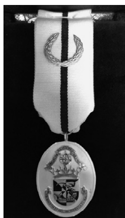
11 – Insígnia da Medalha de Prata de Emérito e Serviços Prestados ao IPL de 2.ª classe

A Medalha de Prata de Emérito e Serviços Prestados ao IPL de 2.ª classe, com insígnia para o peito, com fita de suspensão de seda ondeada de prata, passadeira: de prata, pendente de prata oval, com as armas completas do IPL esmaltadas (fig. 11).