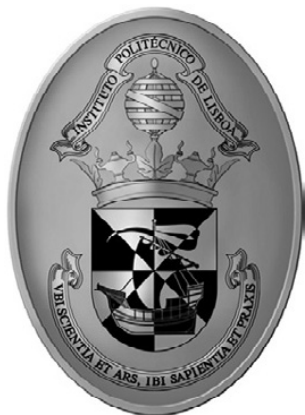
5 – Desenho da insígnia de Presidente do Politécnico de Lisboa

com as armas do IPL. O presidente do Conselho-Geral usa colar de prata (fig. 6) e os outros conselheiros cooptados de bronze.