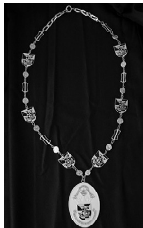
6 – Colar de Presidente do Conselho Geral do Politécnico de Lisboa