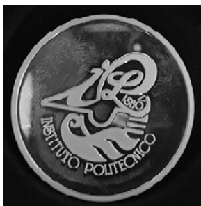
7 – Medalha de Prata de Emérito e Serviços Prestados ao IPL de 1. a classe

Na sequência da criação de heráldica houve uma reforma das distinções atribuídas pelo Politécnico de Lisboa: de uma situação existente onde as medalhas de distinção não eram portáteis, caso da Medalha de Ouro de Conhecimento e Mérito do IPL e da Medalha de Prata de Emérito e Serviços Prestados ao IPL de 1. a classe (fig. 7). Excetuava-se a Medalha de Prata de Emérito e Serviços Prestados ao IPL de 2. a classe, atribuída aos funcionários que haviam trabalhado pelo menos 10 anos ao serviço da instituição e que se aposentavam, que era constituída por uma insígnia de peito, com fita de suspensão partida de prata e azul, tendo pendente medalha circular de prata, com o logotipo do IPL inscrito (fig. 8).