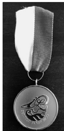
8 – Medalha de Prata de Emérito e Serviços Prestados ao IPL de 2. a classe

Todas as medalhas do IPL passaram a ser condecorações e a ter características falerísticas, ou seja, passaram a ser portáteis e passaram a incluir nas insígnias as suas armas.