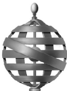
4 – Timbre do Politécnico de Lisboa

A proposta de timbre derivou da universalidade do ensino superior, mas remetendo também para os Descobrimentos Manuelinos, através da utilização do corpo da empresa do rei D. Manuel I, a esfera armilar, um importante instrumento tão aplicado na navegação através da astronomia (fig. 4).