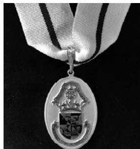
10 – Insígnia da Medalha de Prata de Emérito e Serviços Prestados ao IPL de 1.ª classe

A Medalha de Prata de Emérito e Serviços Prestados ao IPL de 2.ª classe, com insígnia para o peito, com fita de suspensão de seda ondeada de prata, passadeira: de prata, pendente de prata oval, com as armas completas do IPL esmaltadas (fig. 11).