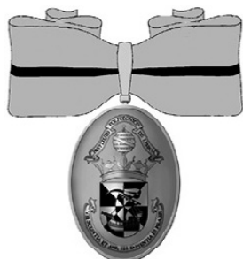
9 – Desenho da Insígnia da Medalha de Ouro de Conhecimento e Mérito do IPL

10), com insígnia para pescoço com gravata constituída por fita de seda ondeada de prata, com um filete longitudinal de negro, argola espalmada cinzelada e canelão de ouro / prata, tendo pendente oval de ouro / prata, com as armas completas do IPL esmaltadas.