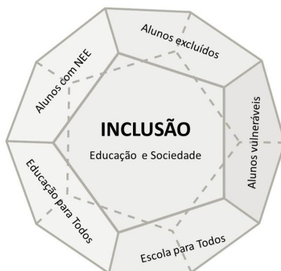
Figura 1. Seis formas de perspetivar a inclusão (com base em Ainscow et al., 2006 e Echeita, 2013)

Torna-se evidente que a inclusão pode ser perspetivada ora como uma meta que se pretende atingir na sociedade, ora como princípio fundamental a ter como referente na intervenção educativa e pedagógica, uma vez que implica o desenvolvimento de processos que procuram garantir a alunos vulneráveis, a alunos excluídos e a alunos com NEE uma educação de qualidade, nos contextos regulares de ensino.