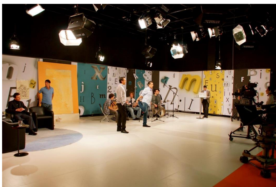
(imagem 3 – Estúdio do Porto Canal)

Pode considerar-se que, tendo em conta o número de funcionários e de fluxo de trabalho, os recursos materiais têm conseguido, na maioria das vezes satisfazer as