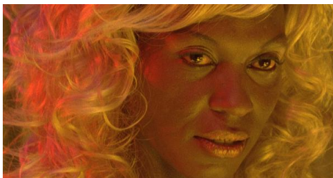
Morrer como um homem , de João Pedro Rodrigues